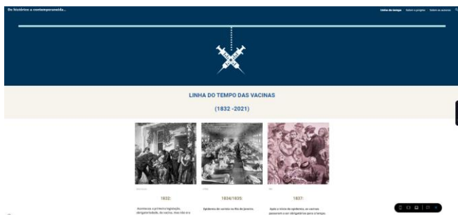
Figura 2. Aba inicial do site, contendo inicialmente as informações iniciais da linha do tempo

Dessa forma, com base no planejamento metodológico que está sendo construído, é possível já apresentar um esboço do site contendo a aba inicial com a linha do tempo (figura 2)